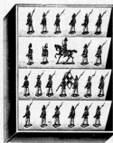
1500, 1512, 1526